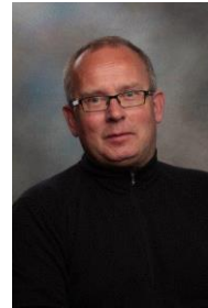
Rådgjevar Lærer i Entreprenørskap m.m.