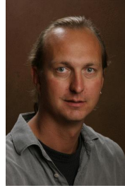
Kontaktlærer Vg3 Lærer i sosiologi, norsk og historie m.m.