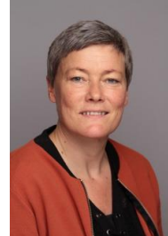
Avdelingsleiar Faglærer i tysk m.m.