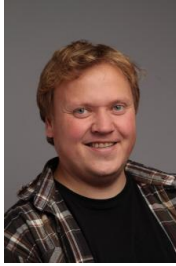
Faglærer i kroppsøving., matematikk m.m.