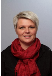
Kontaktlærer Vg2 Lærer i norsk, engelsk m.m.