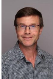
Lærer i kjemi og matematikk for realistar