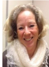
Kontaktlærer Vg2 BUA r