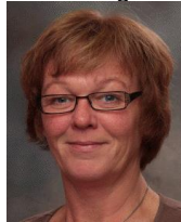
Kontaktlærer VG1 HO/Assistent.