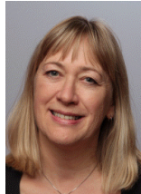
Kontaktlærer Vg2 HEA