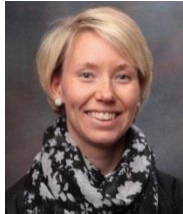
Kontaktlærer Vg1 HO